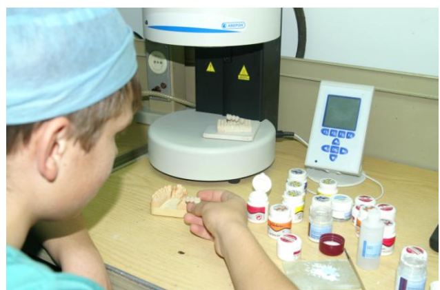
Рабочее место студента