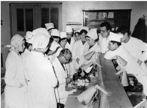
Учебная лаборатория в 1951 году.

С момента открытия в 1941 году на зуботехническом отделении произошли значительные изменения. Администрация колледжа и преподаватели кафедры «Ортопедическая стоматология» стремятся создать на базе отделения условия для успешного обучения студентов — зубных техников в соответствии с требованиями практического здравоохранения. В процессе обучения студенты получают базовые теоретические знания и практические навыки, что позволяет им в дальнейшем совершенствоваться в процессе работы в стоматологических клиниках, развивать свой творческий потенциал.