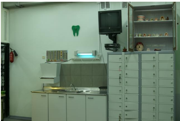
Учебная лаборатория 2006 г.

За последние годы в колледже дополнительно открыто три учебных лаборатории, литейная лаборатория, приобретено много нового современного оборудования — система литейного прессования, оборудование фирмы «Вертекс» для изготовления съемных протезов, фрезерно - параллелометрические установки, электрополировка, пароструйная установка, электровакуумные печи.